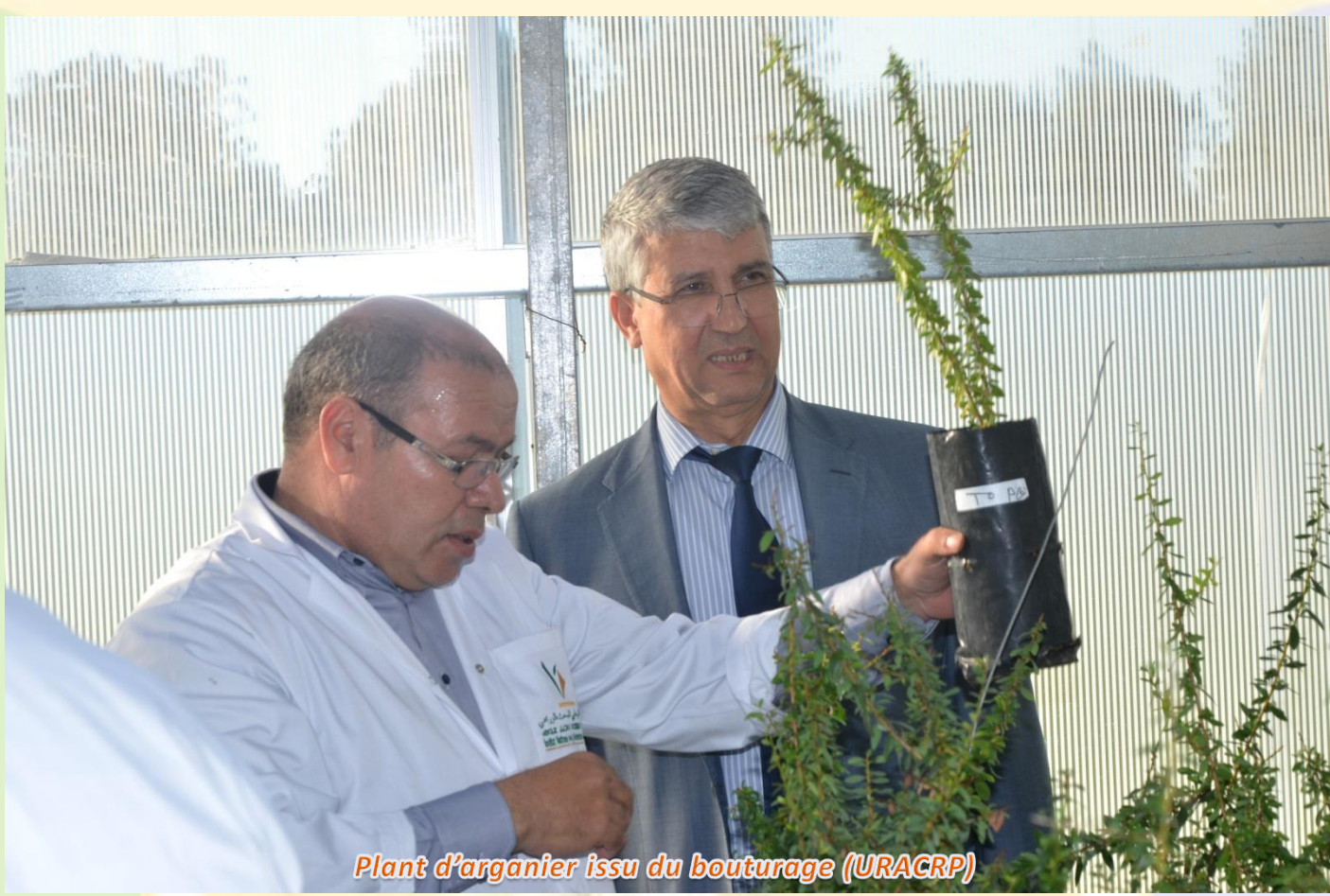
Plant d'arganier issu du bouturage (URACRP)