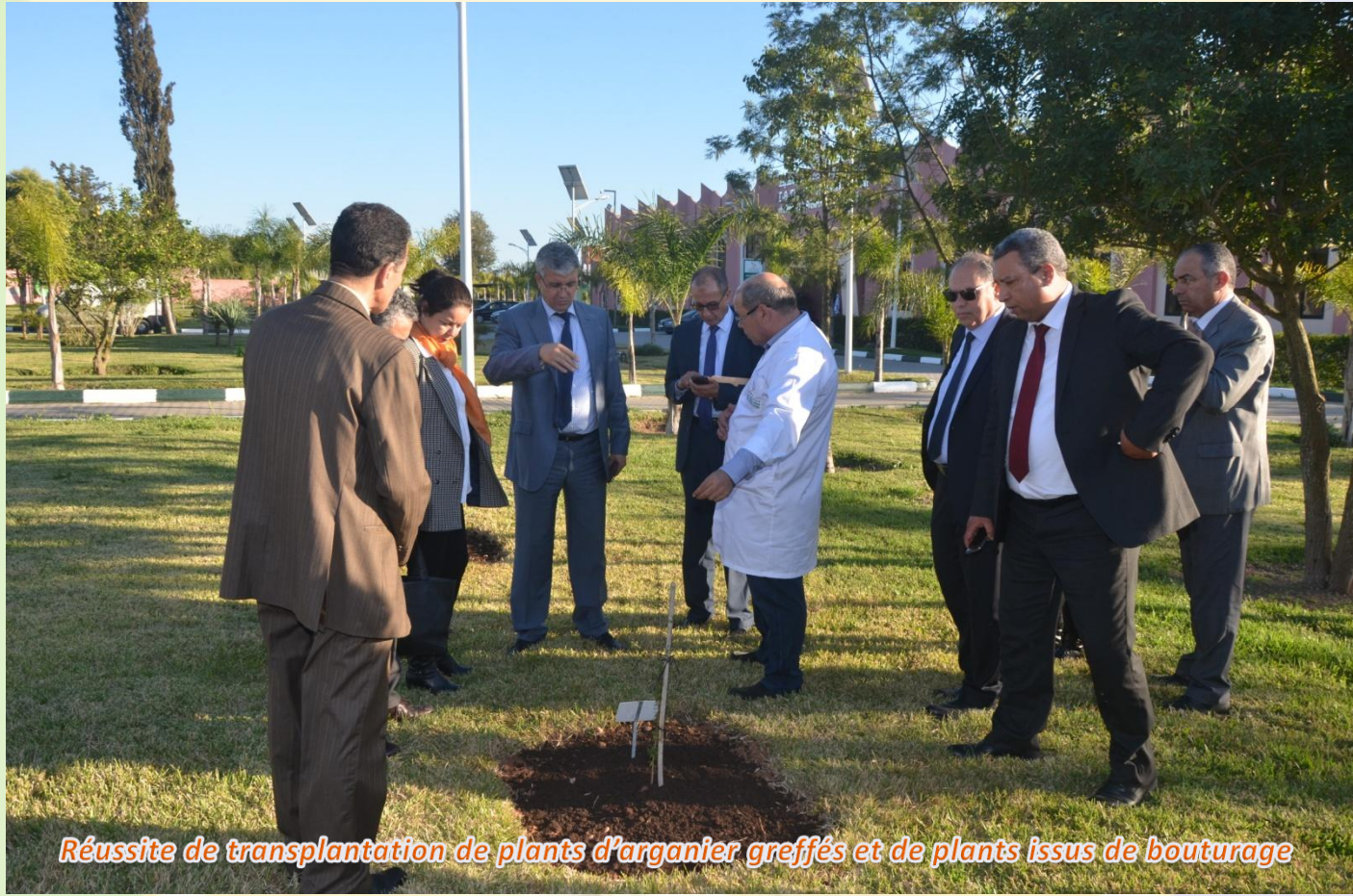
Réussite de transplantation de plants d'arganier greffés et de plants issus de bouturage