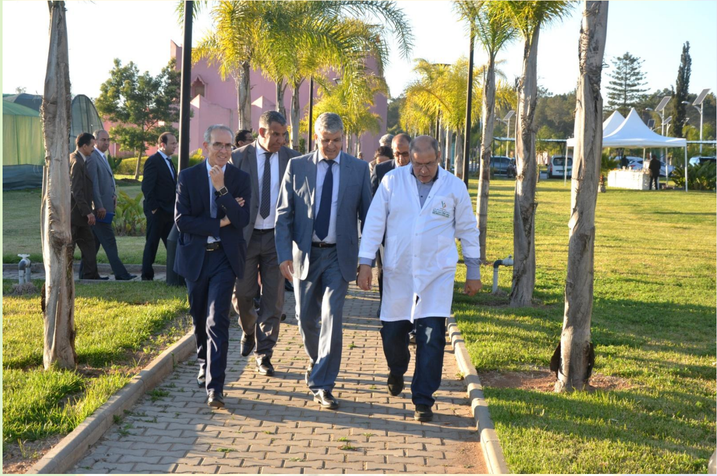
Visite des essais pretests de nouveaux hybrides d'agrumes