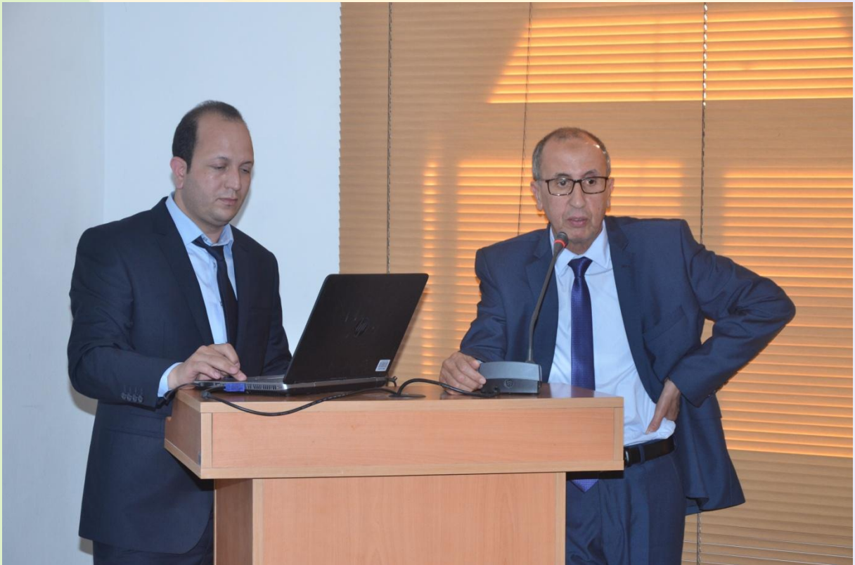
A droite Mr le Président de FIMARGANE

Une deuxième présentation projetée a été faite par le Président de FIMARGANE qui a annoncé la préparation d'un salon international d'arganier.